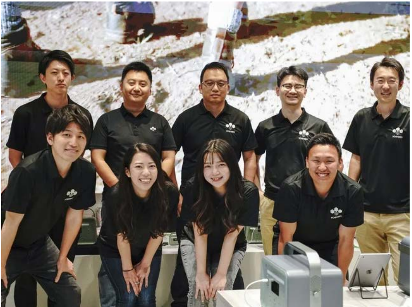
ヨシノパワージャパンメンバー

YOSHINOは世界で初めて固体電池を搭載したポータブル電源を開発した固体電池ポータブル電源メーカーです。私たちのビジョンは、「固体電池技術」を通じてより効率的でスマートなデジタル体験を提供し、すべての方の日常をグレードアップさせることです。2021年にアメリカで創業後、固体電池に関する技術開発やどんな場面でも使えるデザイン、そして安全性を追求するための研究開発を行い2023年より固体電池を採用したポータブル電源を発売しました。