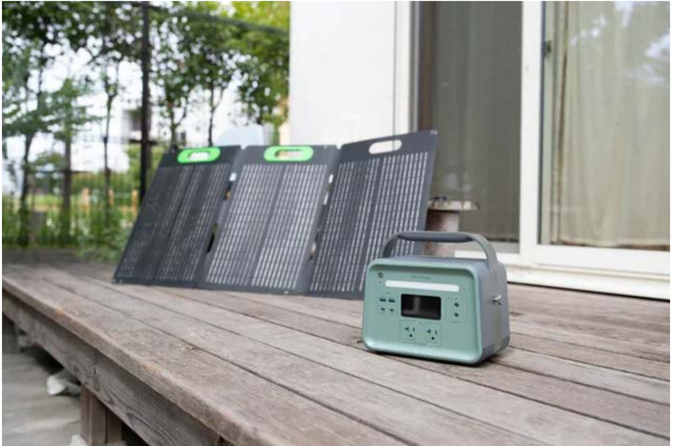
ポータブル電源 B300 SSTとソーラーパネルSP100

会場ではテラススペースを利用して、実際に太陽光のもとでソーラーパネルを接続し、ポータブル電源を充電する充電体験をはじめとした ポータブル電源のタッチ&トライ を開催。普段なかなかその性能を試すことができないポータブル電源や、ソーラーパネルについて実際に動いている様子を試すことが可能です。