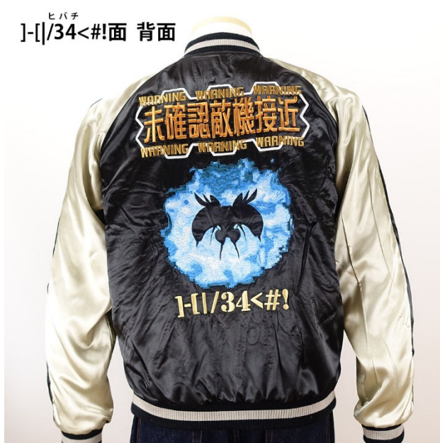
ヒバチ ]-[|/34<#!面 背面