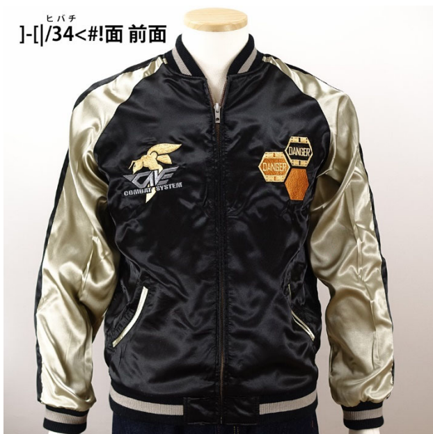
ヒバチ ]-[|/34<#!面 前面