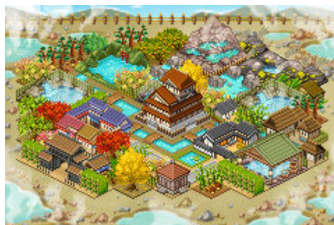
【限定アイテムを配置した城下町イメージ】

本タイアップ企画では、ゲームの利用者が箱根の各所に特設したポイントにて位置情報を送信すると箱根限定アイテムが手に入る設定となっており、箱根の地域活性化を通し、提携企業の運営する各種施設、交通機関の利用者の増加を目指します。