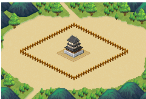
【ゲーム開始時の城下町】

PC公式サイト： http://www.cave.co.jp/social/shirotsuku/