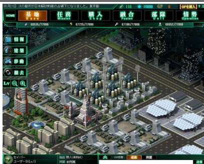
▲近代的な建物で構成された「基地」