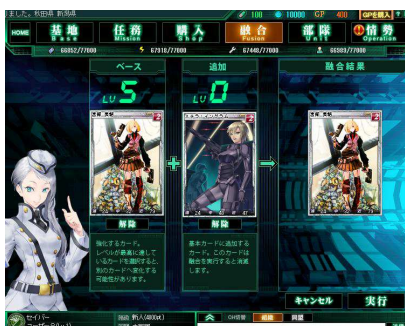
▲兵士間の戦闘データを融合する