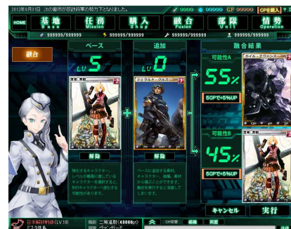
▲パーセンテージが意味するものとは… ※画像は開発中のものです。