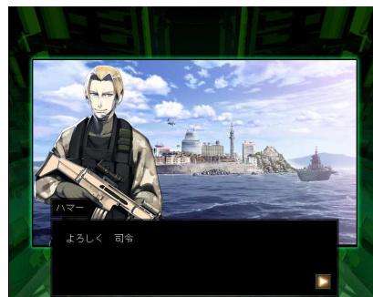
▲重厚なストーリーも魅力