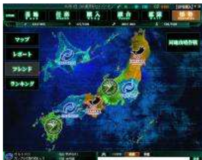
▲47 都道府県が戦場になる—