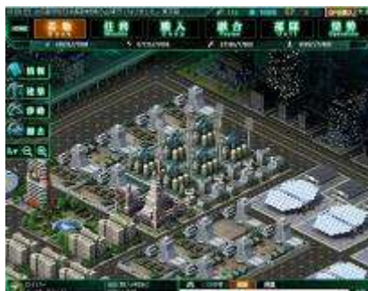
▲自分だけの秘密基地を構築