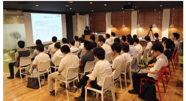
※アンドロイダーが過去に開催した アプリ開発者向けイベント写真