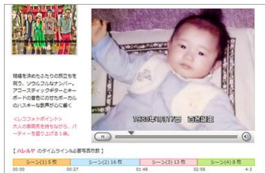
楽曲構成に合わせたカット割りが自動化!!