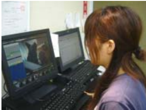
ホテルにいるワンちゃんを実際に確認するスタッフ

少子高齢化・核家族化という社会構造がもたらすペット需要の高まりは、昨今の不況下においても拡大が見込める市場で、ますますその商戦は激化することが予想されます。それゆえに、ペットビジネスでも今まで以上に利用者の評価や口コミを踏まえたCustomer Satisfaction (顧客満足度) 対策が求められています。そんな中、ペットホテル「Andy Cafe」ではお客様へのサービスを向上させる為、“コンシェルジュカメラ”を導入しました。