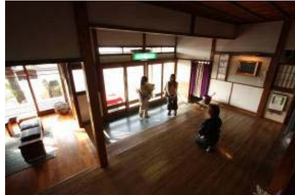
“コンシェルジュカメラ”の視点

昨今の不況により、運営コストを見直す企業も多い中で、「コスト削減をしながらCS向上できるツール」として、注目が集まっています。事実、サービス業界から多くのご要望をいただいております。