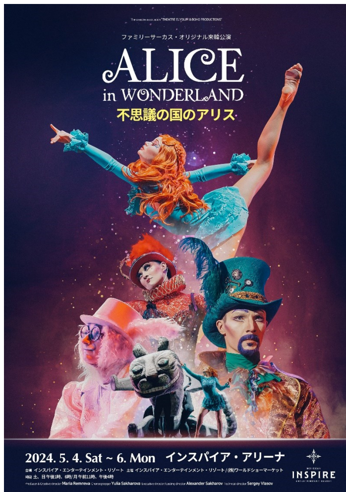
写真1: インスパイア・アリーナで開催されるファミリーサーカス「不思議の国のアリス」ワールドツアー韓国公演(5月4日~6日)の公式ポスター

チケット販売キャンペーン : 4月1日(月)から4月7日(日)までの早期予約期間中にチケットを購入すると30%割引になります。4月8日(月)からは仁川市民の方とINSPIRE Momentum会員は30%割引に、そして10代の方は25%割引になる様々なキャンペーンを実施しています。