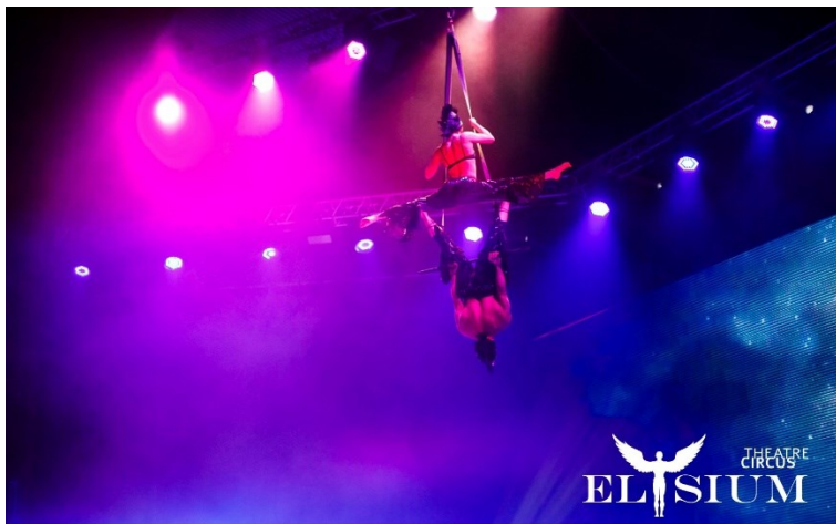
写真3：ファミリーサーカスショー「不思議の国のアリス」ワールドツアーの様子2