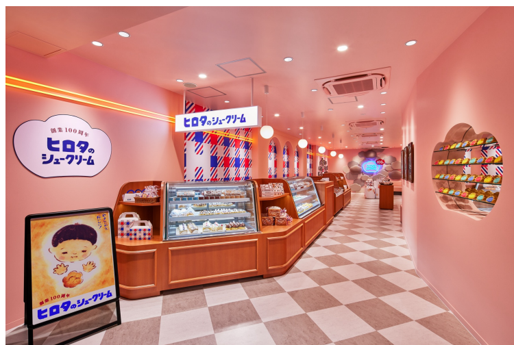
▲ヒロタ 大阪・えびすばし店