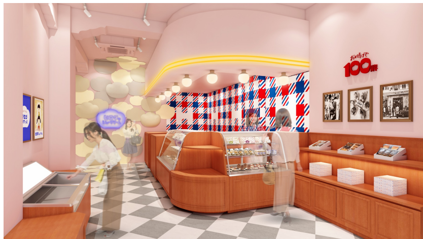
▲ヒロタ 東京・東銀座店イメージ