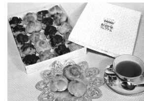
▲(上)パリ エトワール店