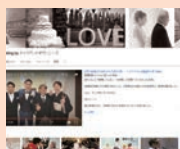
T&Gウェディングプランナーが 多数登場