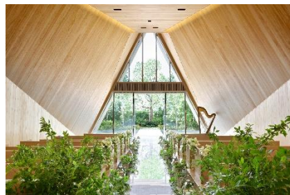
＜ガーデンヒルズ迎賓館（大宮）チャペル＞

予約方法：Peatix（チケット購入サイト） https://peatix.com/event/588462/view