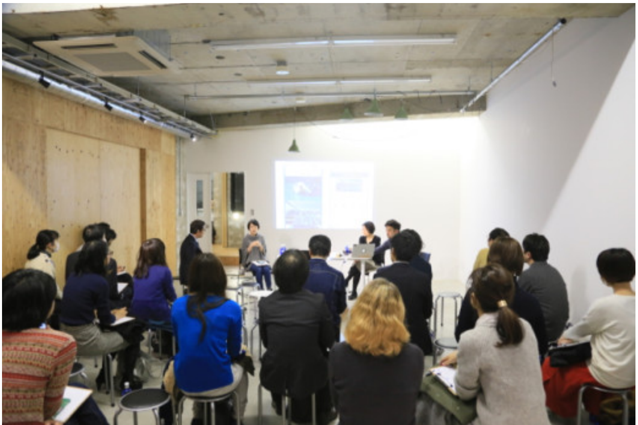
TokyoArtBeatとの共催イベントの風景

シンクルでは、対象への愛を深めるリアルイベント「シンクル大学 カルチャー編愛学部」を定期開催中。各ジャンルの「プロ編愛家」を講師として招き、イベントを開催してきました。