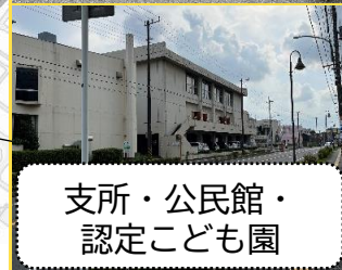
支所・公民館・ 認定こども園