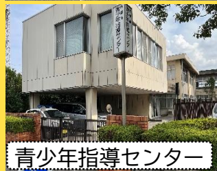
青少年指導センター