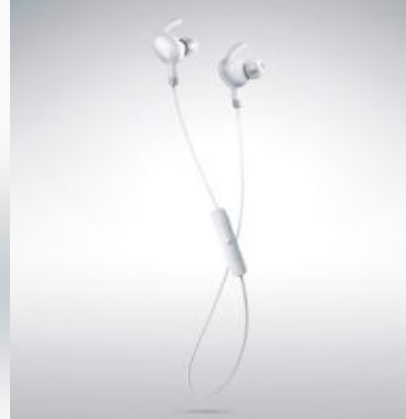
EVEREST 100 (ホワイト)

ハーマンインターナショナル株式会社(本社:東京都台東区、代表取締役社長:仲井一雄)は、アメリカカリフォルニア発祥の世界最大級のオーディオブランド「JBL」から、新たなヘッドホンとイヤホンの最上位シリーズとして「EVEREST(エベレスト)シリーズ」を1月28日(木)より順次発売いたします。