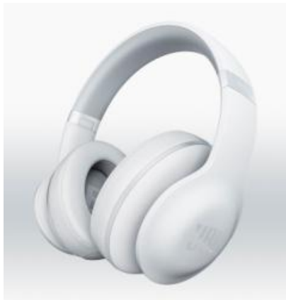
EVEREST ELITE 700 (ホワイト)