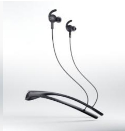
EVEREST ELITE 100 (ブラック)