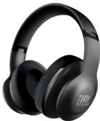
EVEREST 700 (ブラック)