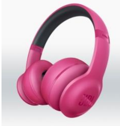
EVEREST 300 (ピンク)