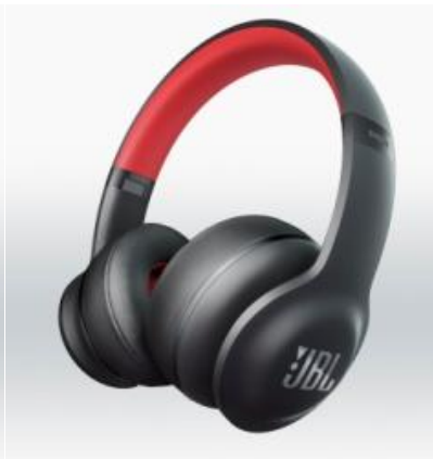
EVEREST ELITE 300 (ブラック/レッド)