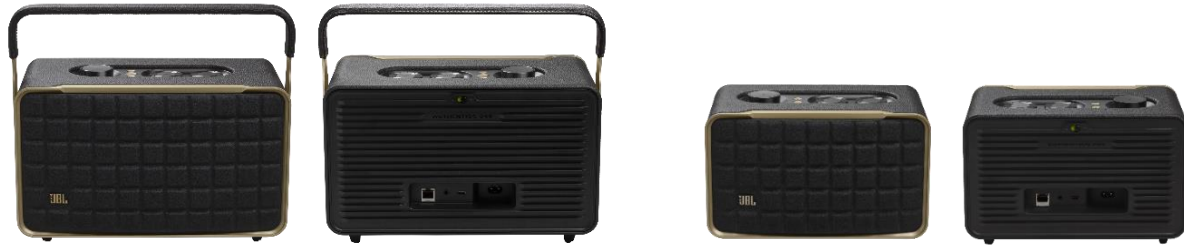
▲ JBL AUTHENTICS 300