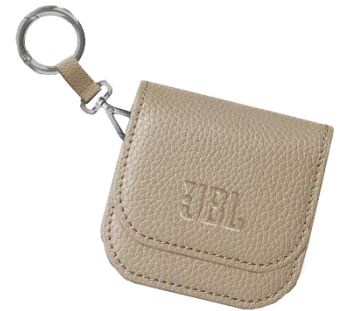
▲キャリングケース(画像はイメージです)