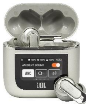
▲シャンパンゴールド