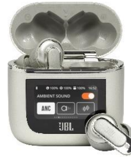
▲シャンパンゴールド