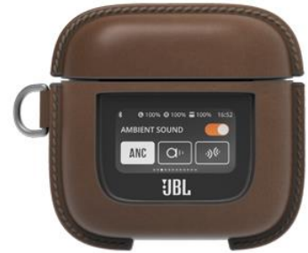
※画像はイメージです。 実際のケースカバーとはデザイン・仕様が一部異なる場合がございます。

※応募受付ページは、3月10日(金)発売日以降にお申込み可能となります。 ※賞品は4月下旬以降のお届けとなります。なお、お送り先は日本国内に限ります。 ※対象製品は日本国内の正規販売店およびJBL公式ストアでの購入に限ります。 ※キャンペーン内容は、予告なく変更・終了することがございます。あらかじめご了承ください。 ※今日現在でのカバーの販売予定はございません。