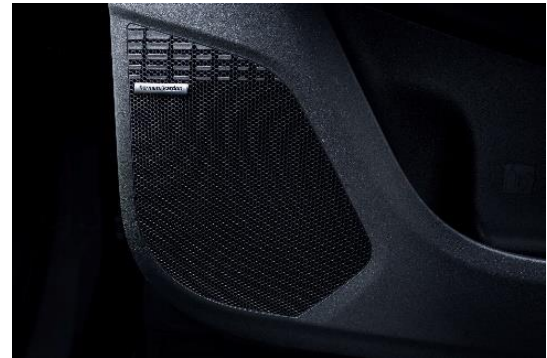
SOLTERRA ハーμανカーオーディオシステム