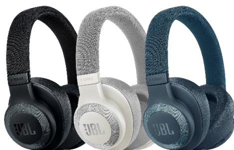
ブラック ホワイト ブルー