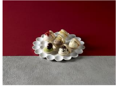
6種のハーゲンダッツ最中 単品1,280円/セット2,400円（税込）

湯葉をオープンで香ばしく焼き上げた、パリパリ食感が特徴的な湯葉ミルフィーユを使用しました。ハーゲンダッツ クリスプチップチョコレートアイスクリームの軽やかな味わいとゆずの風味が豊かな一皿です。