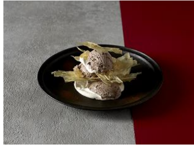
湯葉ミルフィーユ with クリスプチップチョコレート 単品1,080円/セット1,580円（税込）