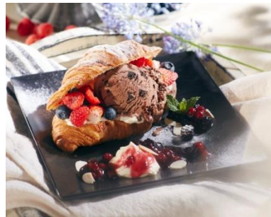
ミックスベリー クロワッサンアイスクリームサンド 1,080円

イチゴやラズベリーなどのミックスベリーと チョコレートブラウニーアイスクリームをクロワッサンに添えて