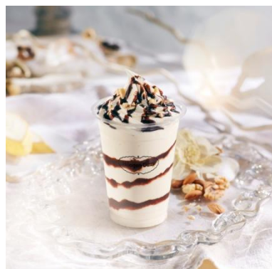
バナナチョコ シェイク 480円