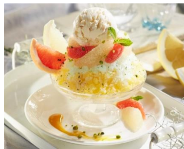
パッションフルーツグラニテ 880円

パッションフルーツとミントのグラニテに マカデミアナッツアイスクリームと グレープフルーツを添えて