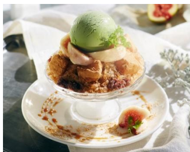
黒糖きなこグラニテ 880円

ハイビスカスとヨーグルトのグラニテに バニラアイスクリームと マンゴーやパイナップルを添えて