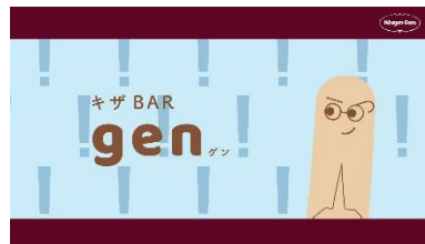
gen (ゲン) ツンデレなかつこつけ