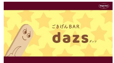
dazs (ダッツ) 明るいお調子者