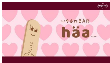
häa (ハー) いつも優しい癒し系