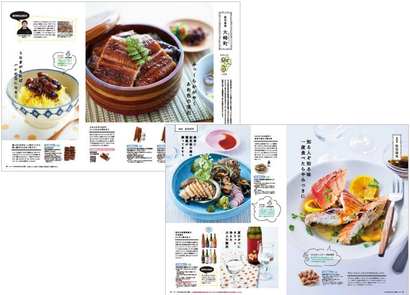
写真左上：カタログ P06-07 鹿児島県大崎町のうなぎのページ 写真右下：カタログ P20-21 長崎県佐世保市の海産物とお酒のページ 「お礼の品」に込められた作り手によるこだわりを読めば、「ふるさと」へイメージが膨らみます。