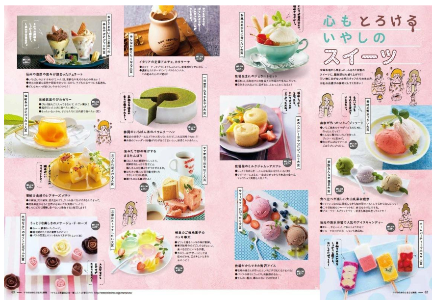
写真上：カタログ P62-63 「心もとろけるいやしのスイーツ」 やっぱスイーツははずせない！ 甘いものに目がない女性スタッフたちが選ぶ「全国スイーツめぐり」は今号も掲載。