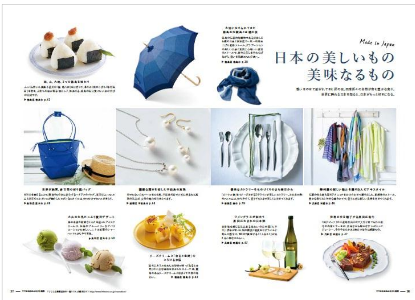
写真上：カタログ P36-37 「日本の美しいもの・美味なるもの」