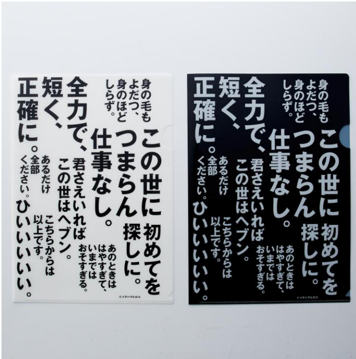
写真：お届けセット例