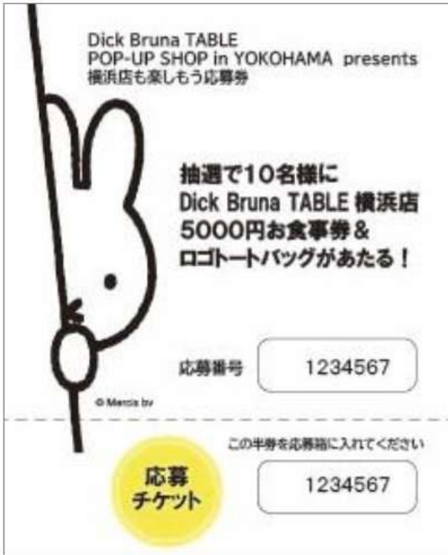
ポップアップショップ特別キャンペーンの応募チケット(イメージ)