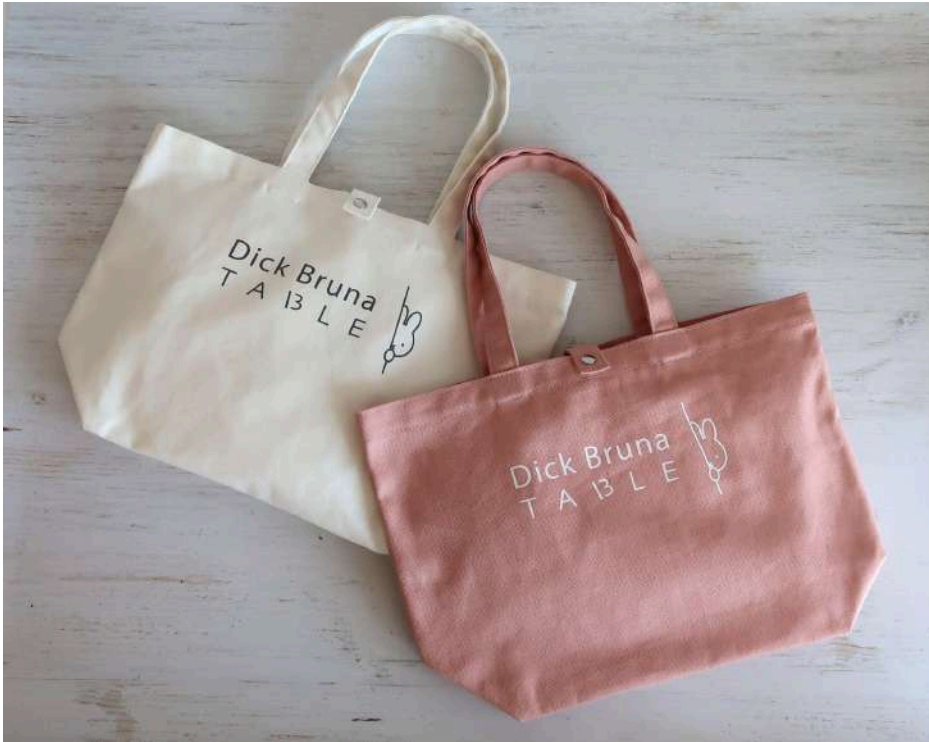
[NEW] ロゴ帆布トートバッグ Sサイズ 新色ホワイト・ピーチ 1個 ¥3,080