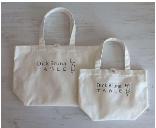
写真左:2色ともSサイズです。写真右:Mサイズ(左)Sサイズ(右)との大きさを比較しています。

ウェブ販売を行わず、神戸店と横浜店でしか手に入らないロゴ帆布トートバッグの新色ピーチとホワイトが登場します。Mサイズは中にはファスナー式の吊りポケットとワインボトルも入れられるボトルホルダー付き、Sサイズは一回り小さいサイズで中にはファスナー式の吊りポケット付き。ちょっとしたお出かけやランチバッグにも使える待望の小さめサイズが新発売です。また期間中は人気のレッド、グレーのほか横浜店限定のブルー、チャコール、神戸店限定イエロー、(別デザインの)ホワイトもラインナップします。