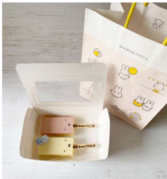
写真左:期間限定の2本セット 写真右:ボックスに入れてテイクアウト