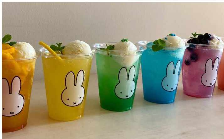
5月から11月まで販売中の、1か月ごとに2種の味が変わるカラフルフロートドリンク。8月はGreen & Blueを提供

・ビスコッティーセット(プレーンとココア各2本入り)、キャラメルポップコーンセット ともに¥1,350(税込)