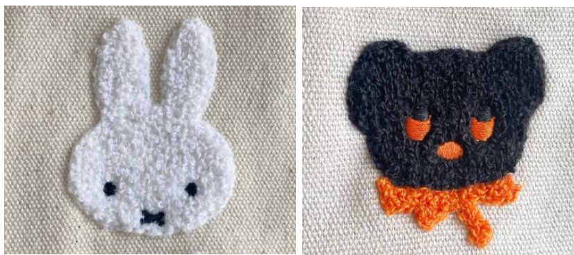
ミッフィーとブラック・ベアのサガラ刺しゅう

※ポップアップショップでは通常版のホワイト(ミッフィー)とグレー(ブラック・ベア)も販売します。