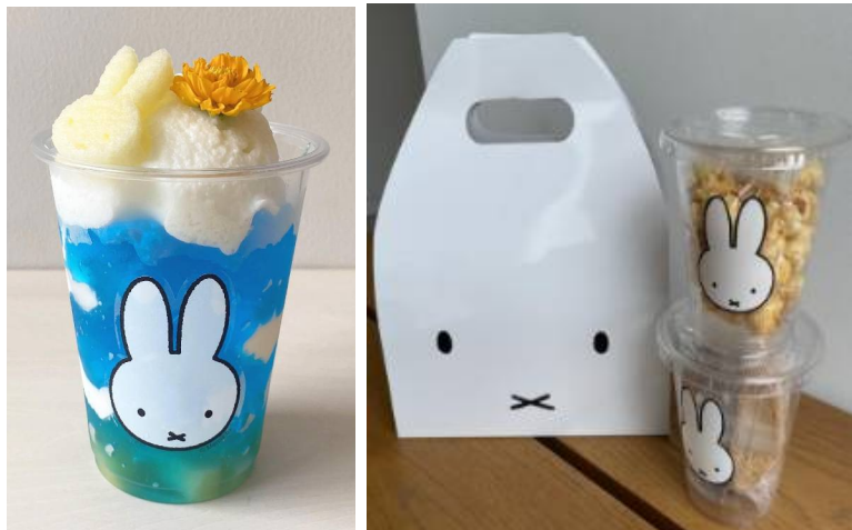
左:「ミッフィーの青空ゼリーソーダ」 右:ビスコッティーセットとキャラメルポップコーンセット

神戸店、横浜店の両店で人気のレインボーカラフルフロートドリンクの特別バージョンとなるゼリーが10日間の期間限定メニューとして新登場。(一日30食限定、テイクアウトのみ)。シュワシュワ感あるソーダゼリーの青空にヨーグルトムースの雲が浮かぶ、見た目も味も爽やかなスイーツです。ミッフィーを模ったリンゴのトッピングのほか、青空ゼリーの下にもパイナップルが入っていて食べ応えも抜群です。溶けにくいので持ち歩きも楽しめます。「ミッフィーの青空ゼリー」とビスコッティーまたはキャラメルポップコーンをミッフィーキャリーバッグに入れたセットも登場します。