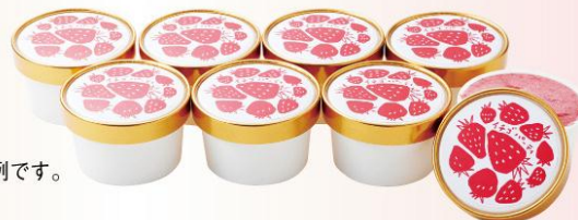
●1回のお届けセット例です。