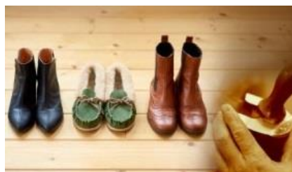
宅配 靴・ブーツクリーニングサービス/ かかと修理 サービス