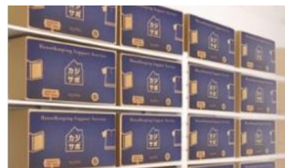
宅配 思い出お預かり サービス