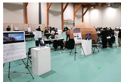
< 昨年の学内展示の様子 >