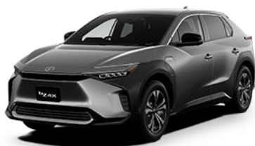
トヨタ BEV 「bZ4X」