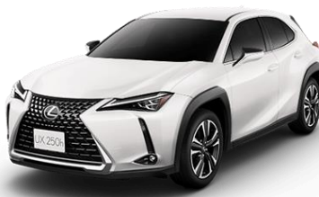
レクサス BEV 「UX300e」