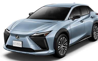
レクサス BEV 「RZ450e」