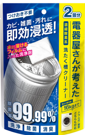
電器屋さんが考えた洗たく槽クリーナー DGW-C01

商品情報 URL： https://www.denkyosha.co.jp/business/original/cat98/dgw-c01.html