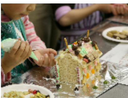
「おかしの家」を作る様子