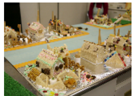
「おかしの家」を並べた街並み