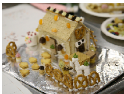
完成した「おかしの家」