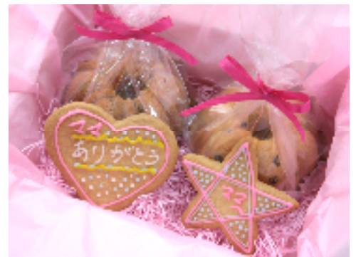
「チョコレートオレンジケーキ2個 & メッセージ付きクッキー」