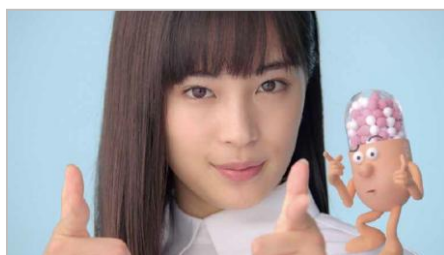
1日2回で、ねらい撃ち!!