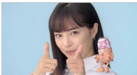
のどが痛い。熱が出た。ねらい撃ち!!