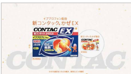
イブプロフェンで、ねらいうち。コンタック EX。