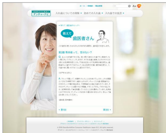
デンチャーナビ「教えて、歯医者さん」掲載イメージ