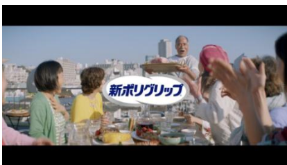
『ポリグリップ®なら、いつもの食事がもっとおいしい!』