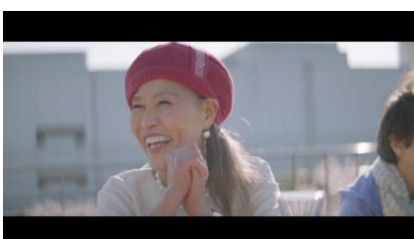
『しかも、食べ物の味を変えにくいから。』