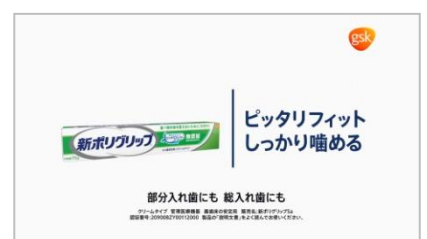
『ピッタリフィット、ポリグリップ®♪』