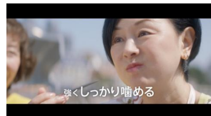
『強くしっかり噛めるから。』