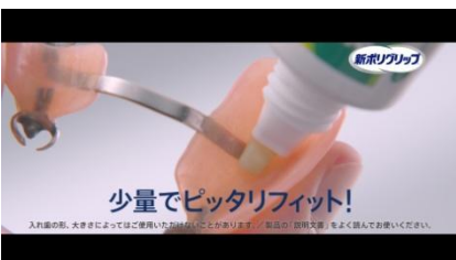
『それは、入れ歯がフィットして』