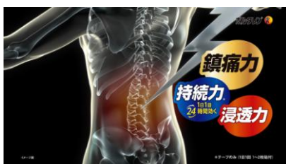
『痛みのもとに「浸透」「鎮痛」「持続」3つの働き』