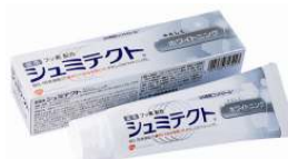
シュミテクト® やさしくホワイトニング (医薬部外品)