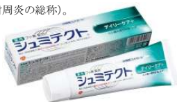
シュミテクト® デイリーケア+ (医薬部外品)

効能・効果:歯がシミるのを防ぐ。ムシ歯予防・歯周病*予防 (*歯肉炎・歯周炎の総称)。