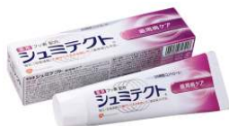
シュミテクト® 歯周病ケア (医薬部外品)