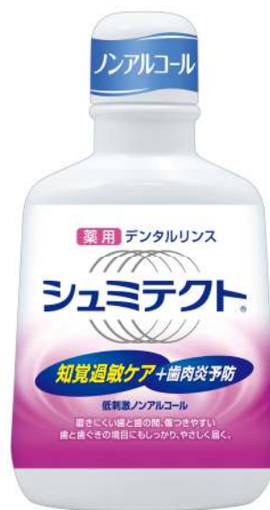
NEW！ シュミテクト ® 薬用デンタルリンス 500ml

風邪薬の「コンタック ® 」や、歯磨き剤「アクアフレッシュ ® 」など、お馴染みのブランドを有する英国系製薬企業グラクソ・スミスクライン株式会社(本社:東京都渋谷区)では、知覚過敏ケアブランド「シュミテクト ® 」から、「シュミテクト ® 薬用デンタルリンス」を2013年9月17日(火)に新発売いたします。