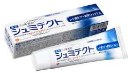
シュミテクト® ムシ歯ケア+爽快ウォッシュ (医薬部外品)