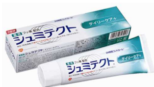
NEW シュミテクト® デイリーケア+(医薬部外品)

「シュミテクト®」シリーズは、この度新発売する「シュミテクト® デイリーケア+」の他に、歯周病(歯周炎・歯肉炎の総称)予防成分を配合した「シュミテクト® 歯周病ケア」、ステイン(着色汚れ)を除去し、歯の持つ本来の自然な白さを取り戻す「シュミテクト® やさしくホワイトニング」、クリアミントジェルで口内を爽快にする「シュミテクト® 爽快ウォッシュ」の4アイテムで多様化する消費者ニーズに対応しています。