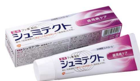
シュミテクト® 歯周病ケア(医薬部外品)