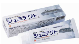
シュミテクト® やさしくホワイトニング(医薬部外品)

効能・効果:歯がシみるのを防ぐ。ムシ歯予防・歯周病*予防(*歯肉炎・歯周炎の総称)。