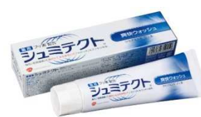
シュミテクト® 爽快ウォッシュ(医薬部外品)