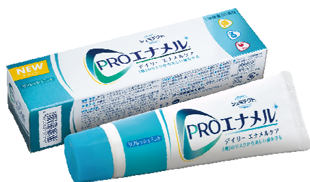
「PRO エナメル®デューエナメルケア」

「PRO エナメル®」シリーズは、独自のエナメルプロテクション処方により、毎日のハミガキで歯のエナメル質を強化し、歯の健康を保ちます。