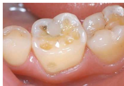
進行すると、奥歯に凹みが現れることがあります。また、詰め物が浮いたり、外れたりすることもあります。