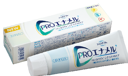
【新製品】「PRO エナメル®やさしくホワイトニングエナメルケア」

歯の表面にある‘エナメル質’は、食べものや飲みものに含まれる‘酸’によって、やわらかくなり、削り取られやすくなります。この状態で歯みがきをすると、歯が薄く弱くなっていきますが、これにより削られてしまった歯のことを“酸蝕歯”と言い、欧米では既に一般化されており、ムシ歯、歯周病に次ぐ第三の歯牙疾患として注目されています。日本でも成人の約6人に1人が、“酸蝕歯”というデータ(*)もあり、さらに、昨今では食の欧米化や美容・健康ブームの影響により、そのリスクは高まっています。