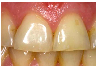
エナメル質が薄くなるにつれて、色の濃い象牙質が透けて見え、歯全体が黄ばんで見えてしまいます。