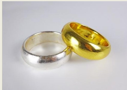
【HAKU LINDEN プレスレット】 ¥87,800