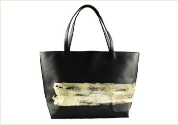
【HAKU トートバッグ SMALL】 ¥88,500