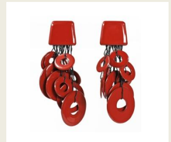
【URUSHI CIRCLE イヤリング】 ¥133,100