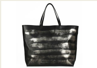
【HAKU トートバッグ】 ¥172,800