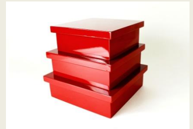
【URUSHI お弁当箱】 ¥41,100