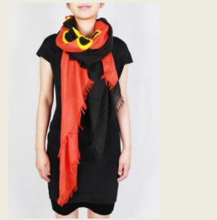
【HANAFUDA UME カシヤストール】 ¥93,200