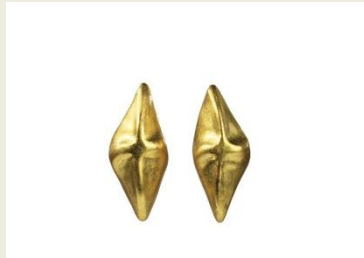
【HAKU LINDEN イヤリング】 ¥87,800