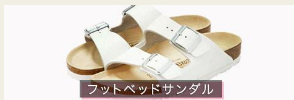
フットベッドサンダル

本格的なガウチョパンツブーム到来！背が低い女性も合わせやすい優秀パンツ。足首をのぞかせることで女性らしさがグッと増します。