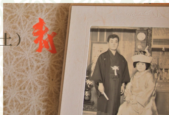
イメージ写真 (昭和時代・自宅での結婚式の様子)