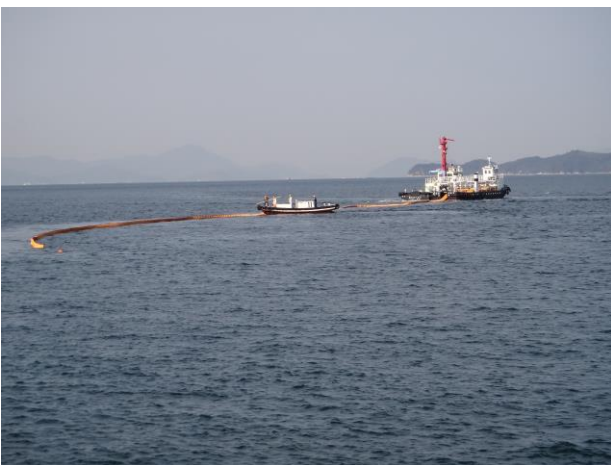
オイルフェンス搭載船からの展張訓練