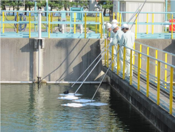
ガードベースンでの流出油の回収