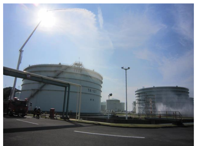
原油タンクのリング火災へ泡消火活動