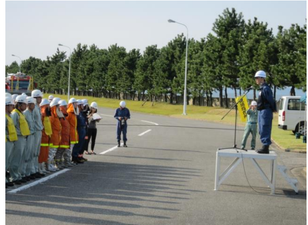
今治海上保安部長からの講評