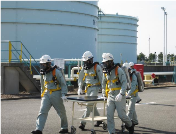
(新規) 酸素呼吸器を装着しサービストンネルに取り残された所員の捜索および救出・救急搬送