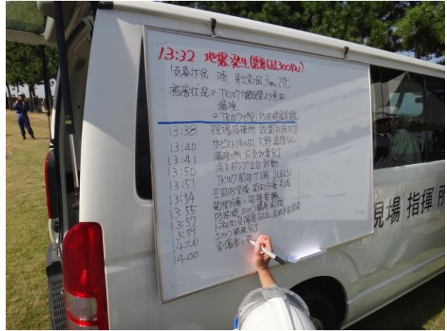
現場指揮所での連絡確認