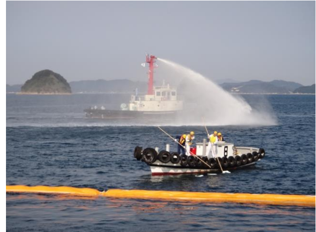
流出油の回収と浮遊油の拡散訓練