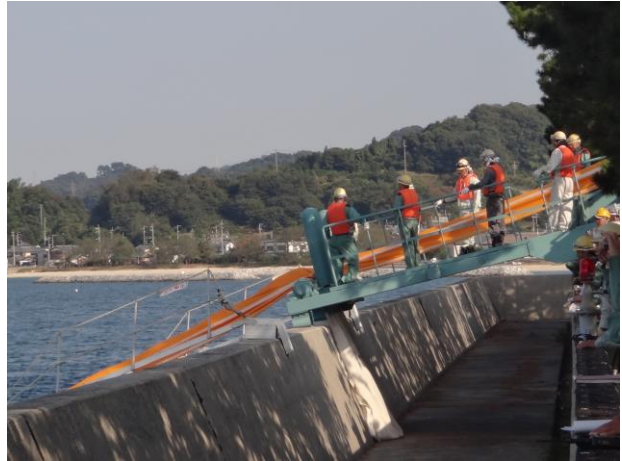
菊間基地所有のオイルフェンス展張訓練