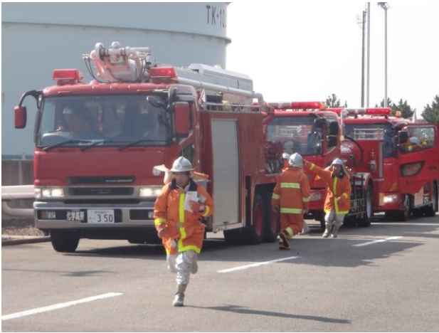
共同防災組織の到着