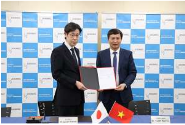
VINACOMIN との署名式 1