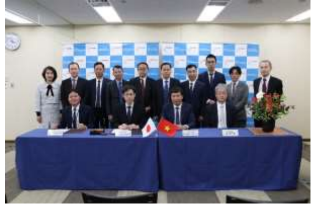
VINACOMIN との署名式 2