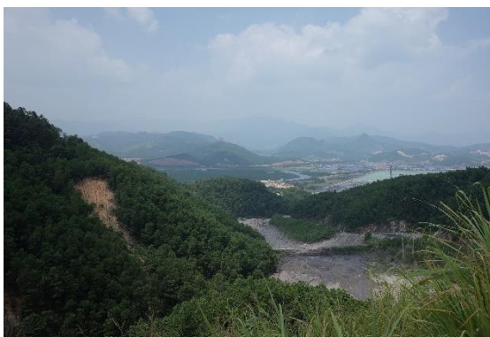
クアンニン炭田地域の風景

クアンニン炭田地域では、これまでのベトナム政府による探査によって、中～高発熱量・低硫黄分の無煙炭を含む複数の未開発石炭層の賦存が確認されており、また、道路、貯炭場、積出港などのインフラが地域内に整備されていることから、新規石炭資源の開発ポテンシャルの高い地域として期待されます。本調査により、ベトナムにおける主要な無煙炭生産・輸出企業である VINACOMIN との関係が強化され、新規開発対象となる資源量が把握されれば、わが国への無煙炭の安定供給に貢献することになります。