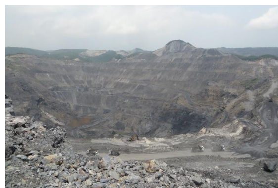
クアンニン炭田で操業する炭鉱