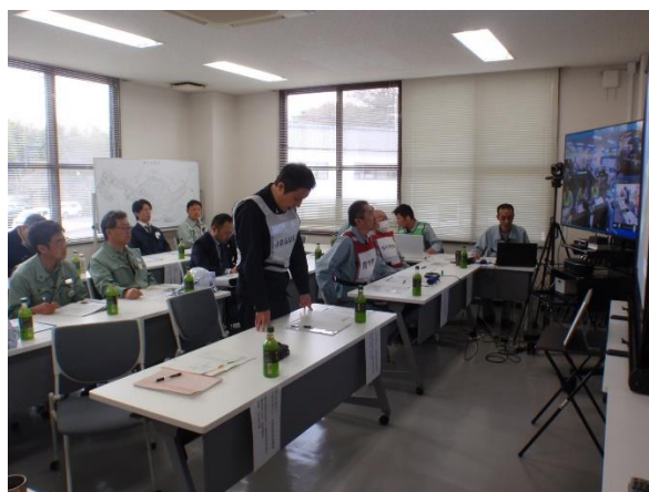
訓練開始指示(本館会議室)