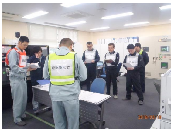
訓練開始前打ち合わせ(計器室)