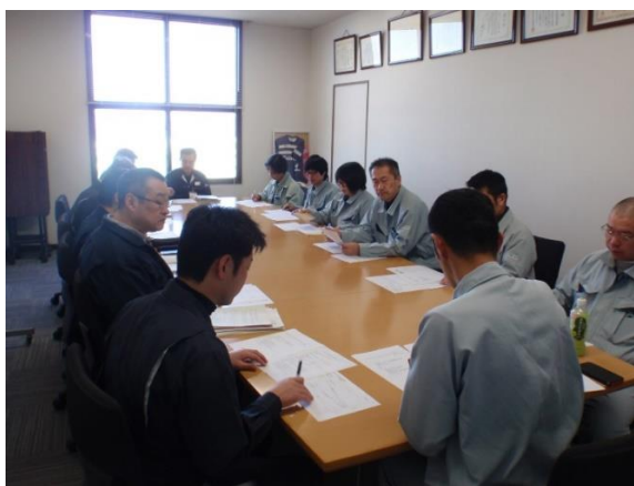
訓練事前確認会(本館会議室)

http://www.jogmec.go.jp/about/domestic_008-04.html