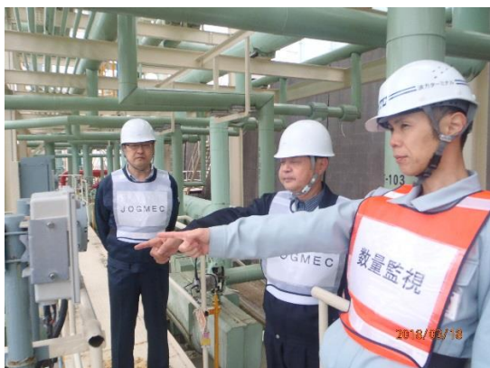
配管満液確認(現場)