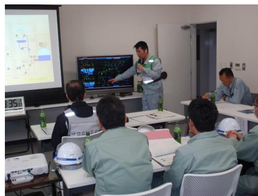
作業進捗状況説明(本館会議室)