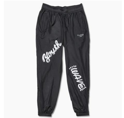
名称 : Chocomoo ベクター トラックパンツ