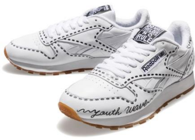
名称 : CL LEATHER CHOCOMOO (クラシックレザー チョコムー)