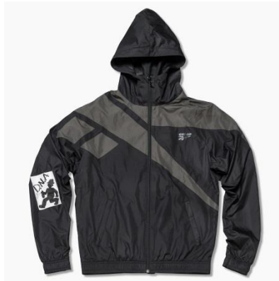
名称 : Chocomoo ベクター フーデッドトラックトップ