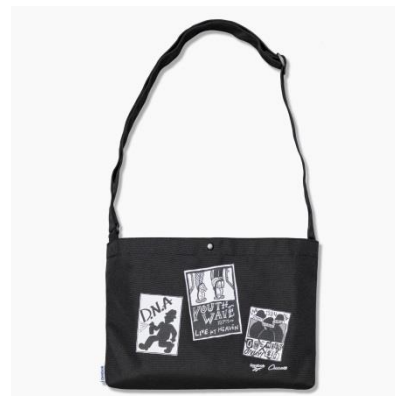
名称 : Chocomoo ベクター サコッシュ