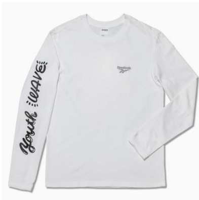
名称 : Chocomoo ベクター ロングスリーブ TEE